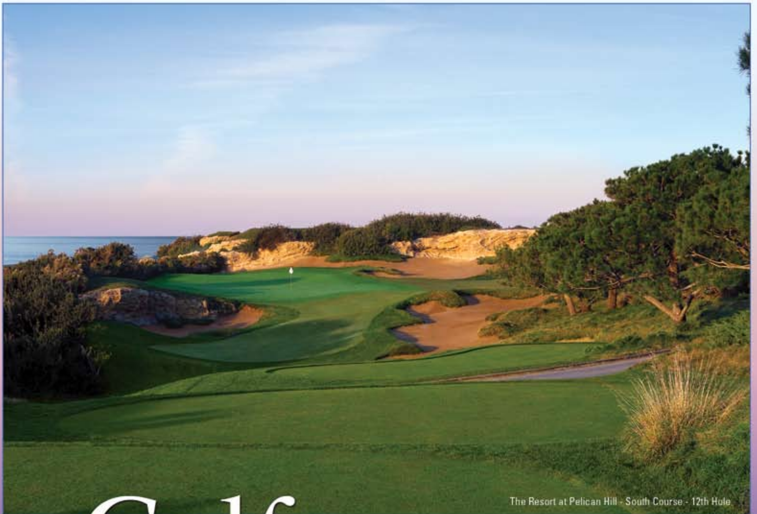
The Resort at Pelican Hill - South Course - 12th Hole